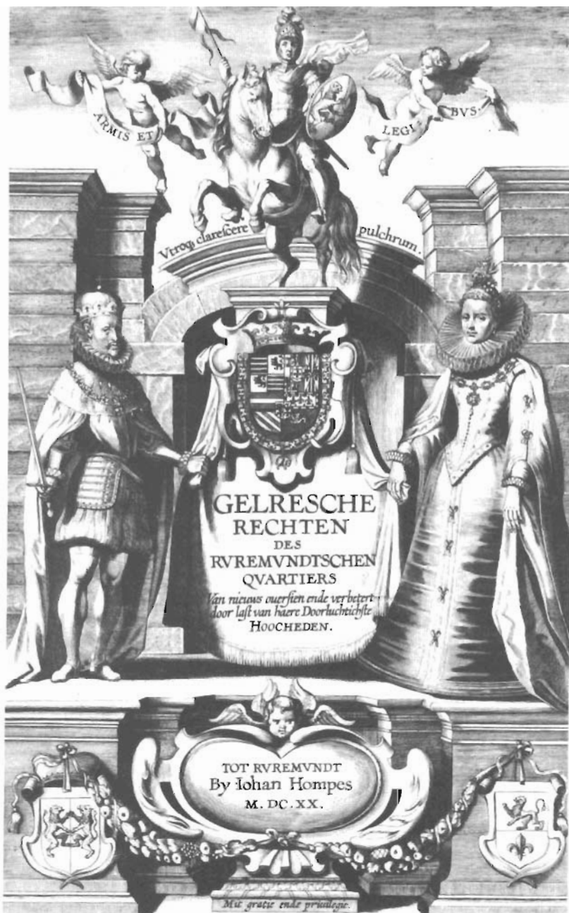
Titelpagina van de eerste druk van het Gelderse Land- en Stadsrecht (1620). Gravure naar een ontwerp van P.P. Rubens.