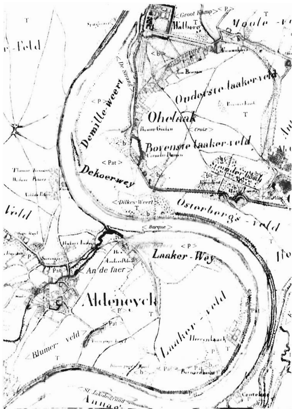
Afb. 2. Fragment uit de Tranchotkaart met in het centrum de Dulken'sweert, op de kaart 'Dilkes-Weert' genoemd.